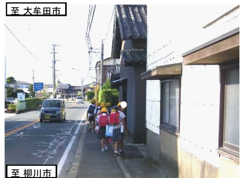
狭い歩道を通学する小学生