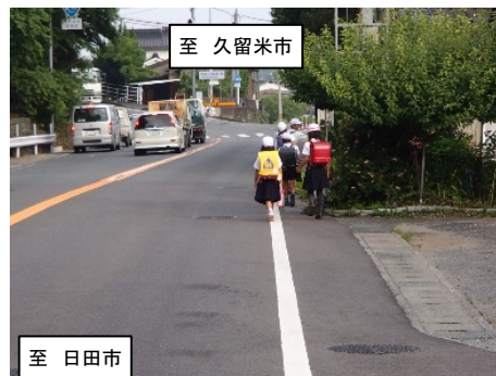
国道210号の狭隘な歩行空間を通学する小学生