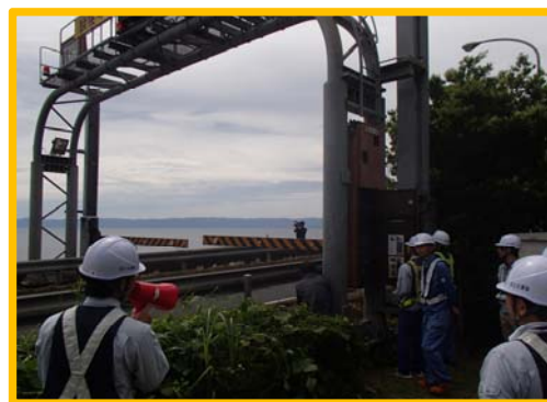
【遮断機操作訓練の様子】

※「異常気象時通行規制区間」とは、大雨や台風による土砂崩れや落石等のおそれのある箇所について道路を利用する方々の安全を確保するために、予め設定している規制実施基準に基づき道路管理者が通行を規制する区間のことです。(別紙2)