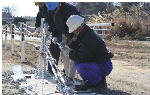
ワイヤーロープ式防護柵復旧（夜間）