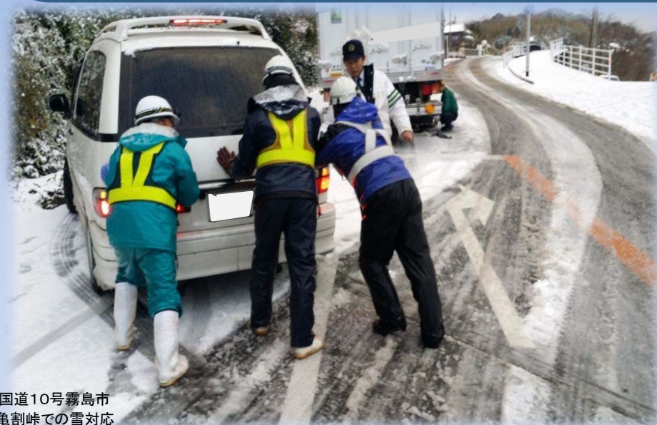
国道10号霧島市 亀割峠での雪対応