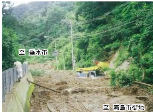
▲国道への土砂流入 (H5.8)