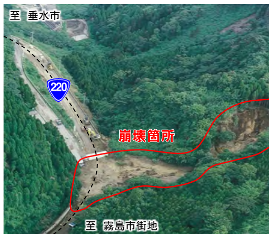
▲災害箇所航空写真 (H5.8)