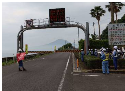
【遮断機操作訓練の様子】

※「異常気象時通行規制区間」とは、大雨や台風による土砂崩れや落石等のおそれのある箇所について道路を利用する方々の安全を確保するために、予め設定している規制実施基準に基づき道路管理者が通行を規制する区間のことです。(別紙2)