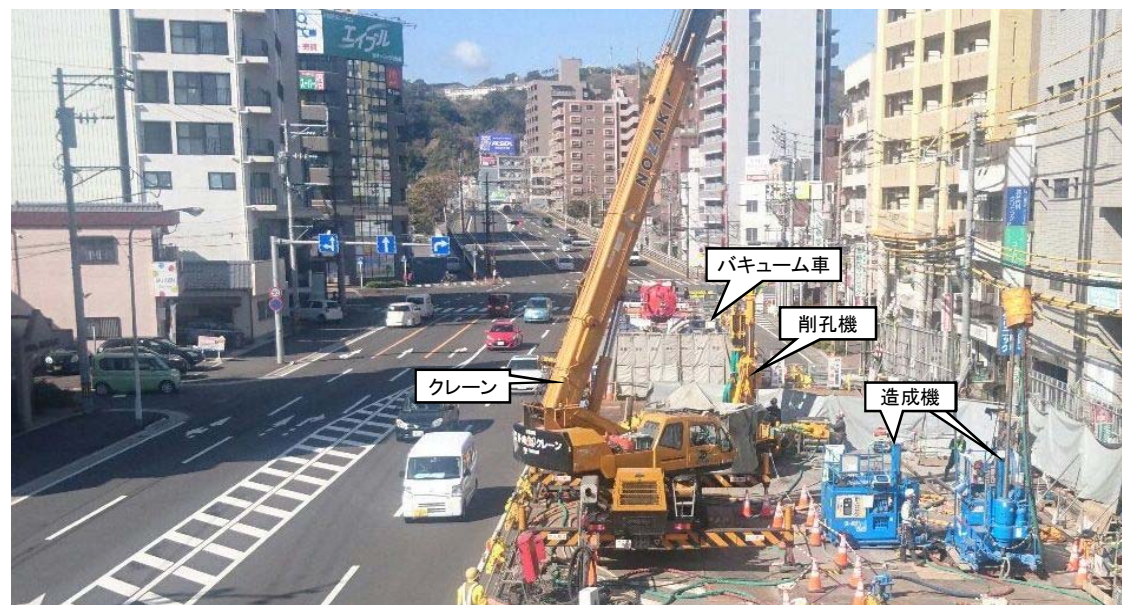
地盤改良工施工状況