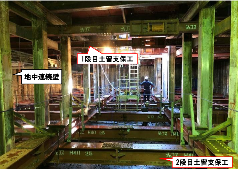
立坑内の様子(2019年12月2日)

掘削中は粉じん量を測定し、換気設備が周辺環境に影響を与えていないことを確認しています。