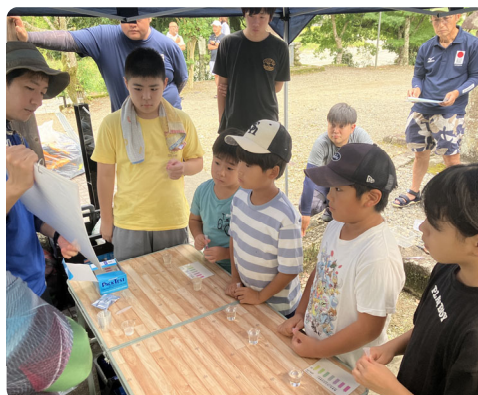
きれいな水と濁った水の水質の違いの解説

次に、川の濁りと汚れを調べる実験にチャレンジ！ 普段の水量のきれいな水と、川が増水して濁った水をイメージした水を比べて、見た目のきれいさ(濁り)と汚れ(水質)の違いなどを自分の目で確かめました。そして、川が環境が常に変化していること、川の豊かさを守るために大切なことをふりかえりました。