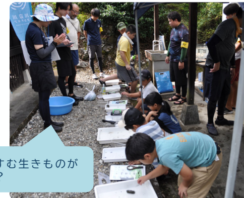
採集した水生生物による水質しらべ