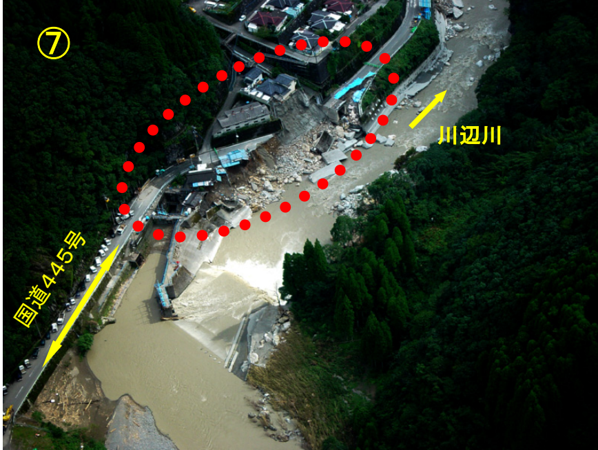
国道445号崩落箇所 (五木村築切地先)