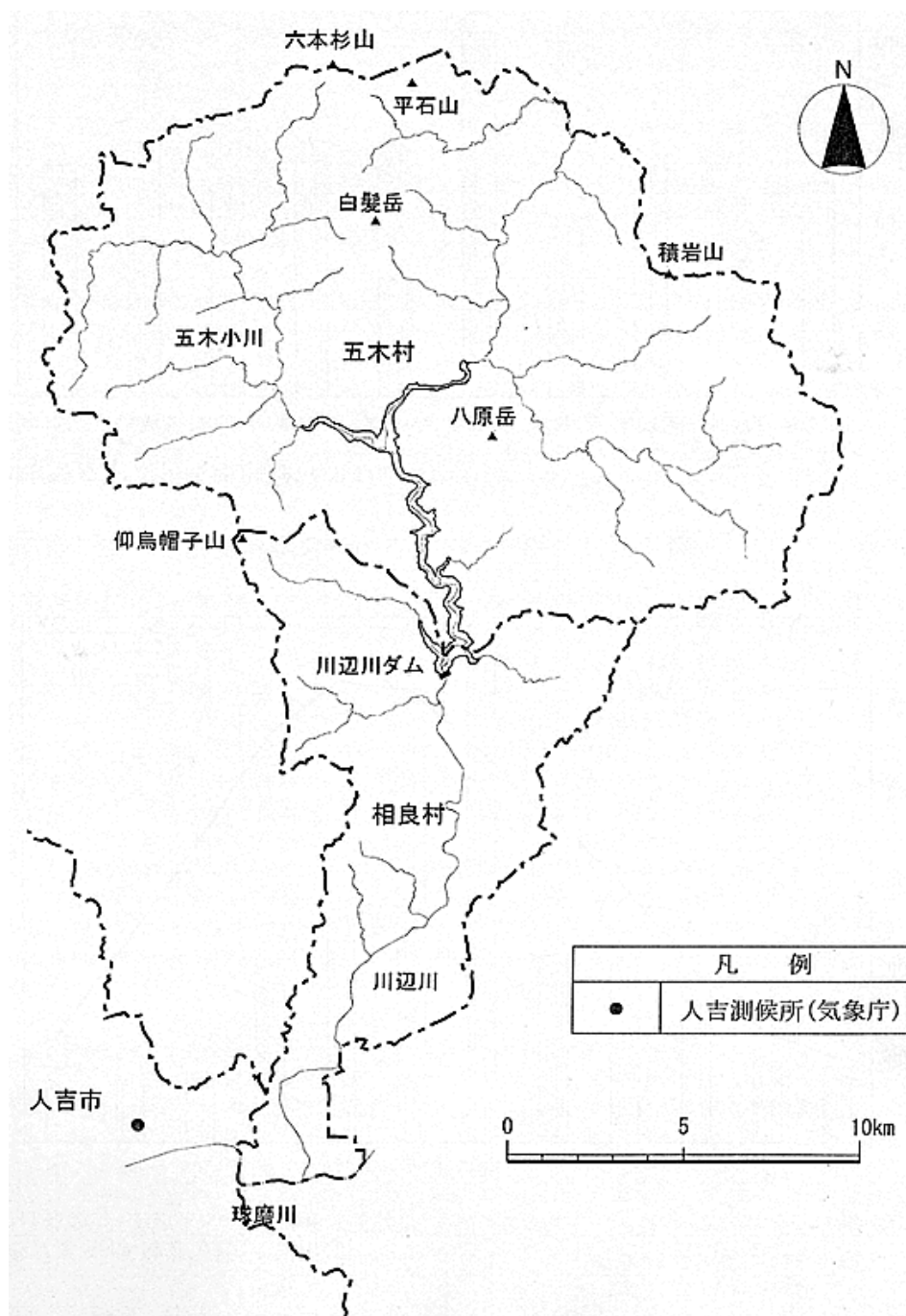
図 2.1.1.1-1 気象観測地点

人吉市の気象の状況は図 2.1.1.1-2 及び図 2.1.1.1-3 に示すとおりである。人吉市の年平均降水量は 2,524mm(平成元年～平成 10 年)で、日本の年平均降水量 1,714mm(昭和 41 年～平成 7 年)と比較して多い。月別平均降水量では、6～7 月を中心とする梅雨期に降水量が集中している。年平均気温は 15.5℃、月平均気温の最高は 26.3℃(8 月)、最低は 4.8℃(1 月)である。