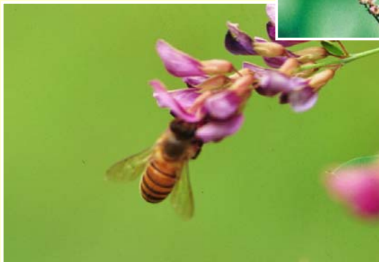
ニホンミツバチ(集密)