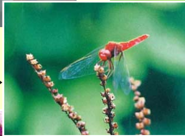
ショウジョウトンボ(生息場)→