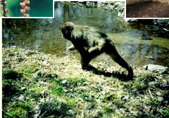
ニホンザル(水飲み)