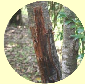
ニホンジカの角研ぎ跡