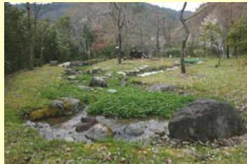
小鳥の水浴び場、水飲み場

小鳥の餌になる木の植栽 カブトムシ類の産卵場 クワガタムシ類の産卵場 止まり木 小動物のすみ家、越冬場所 など