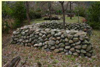
昆虫類や小動物の越冬場所、小動物の避難場