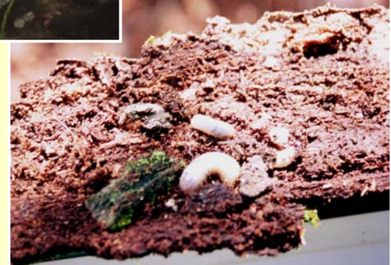
クワガタムシ等の幼虫(産卵場)