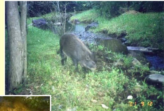
イノシシ(食餌、水飲み)