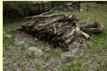
クワガタムシ類の産卵場