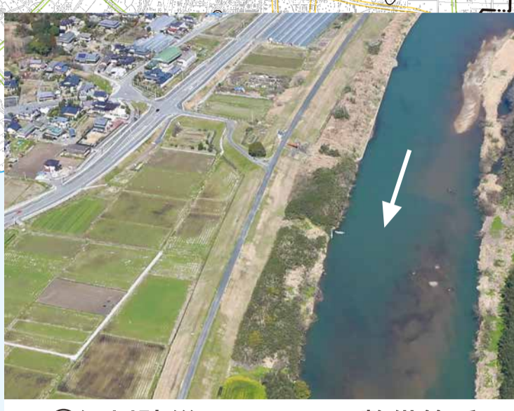
② 河川防災ステーション整備箇所