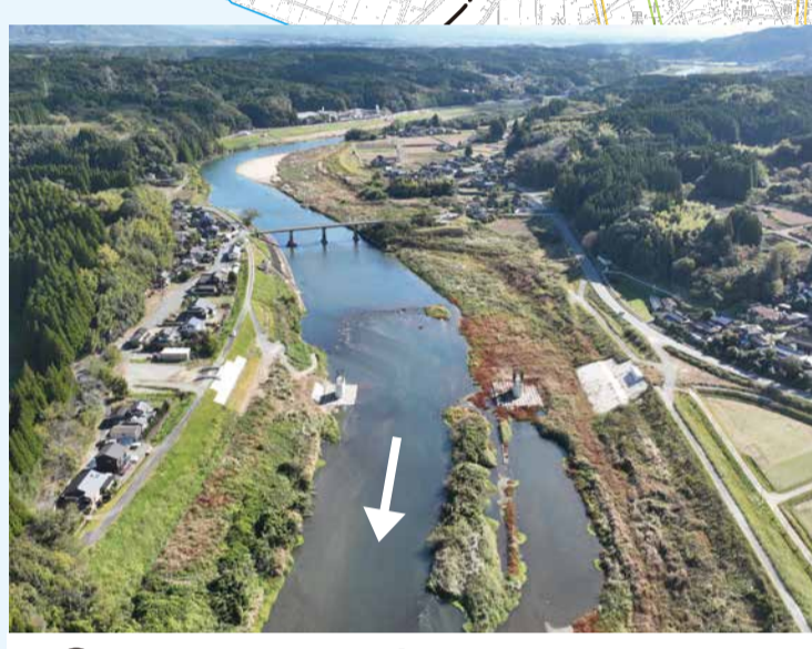
③ 菊池川中流部電門・菰田改修事業