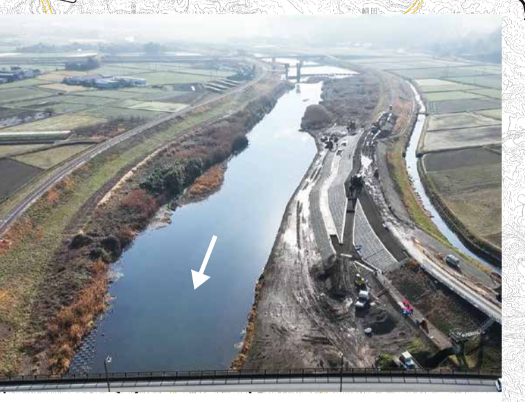
⑤ 菊池川上流部堤防強化事業