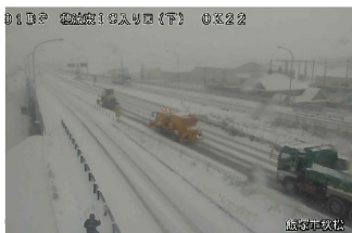
国道201号 R3.1.8の作業状況