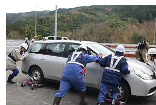
立ち往生車両移動訓練