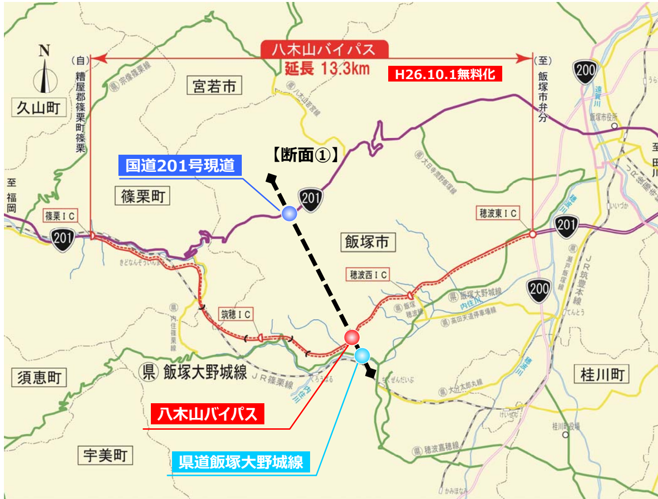
【断面①】の交通量の変化

○並行する国道201号現道および県道飯塚大野城線の交通量は半減し、八木山バイパスに転換