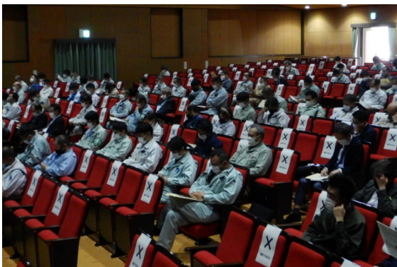
(令和3年度 安全研修会の模様)

コロナ対策として、マスクの着用、体温測定、着席の間隔を空ける等の対策を行い、開催する予定です。