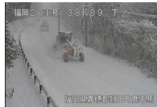
国道201号 令和3年1月除雪作業