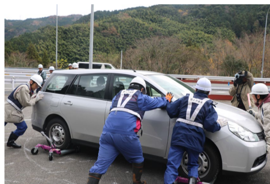
立ち往生車両移動訓練