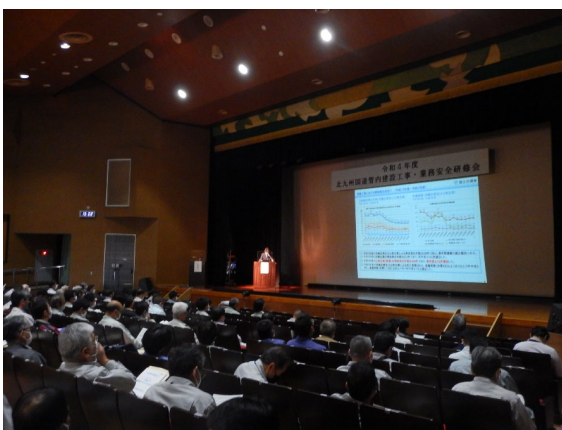
(令和4年度 安全研修会の模様)