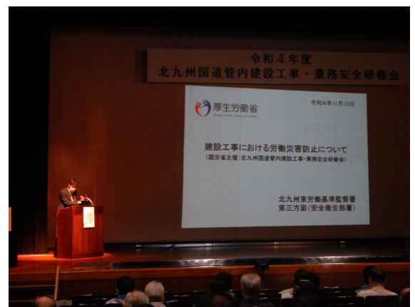
(令和4年度 講師による講義風景)