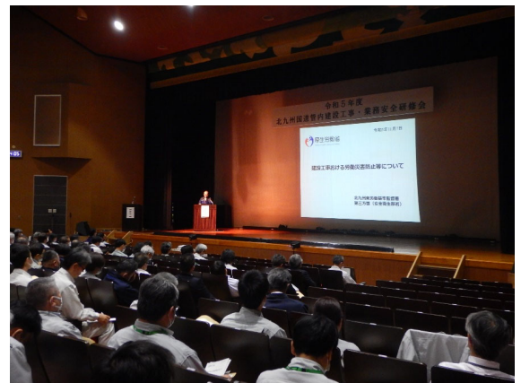
(令和5年度 講師による講義風景)