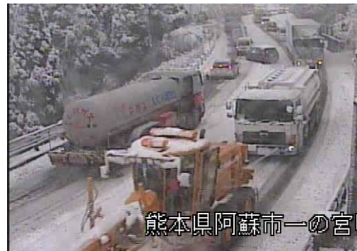
大雪での牽引（H30年1月）