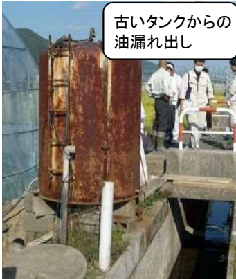
古いタンクからの 油漏れ出し

※例年、冬場において、老朽化等による亀裂・破損によりビニールハウス用暖房設備から重油が漏れ、水路や河川に流出する事故が多発していますので、使用者は設備の点検を実施するなどの注意をお願いします！また、関係機関は、使用者に対して注意を呼びかけましょう！