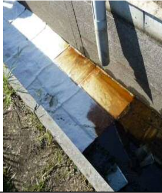
送油管の老朽化等による亀裂・破損箇所から油が排水路に流出!!!