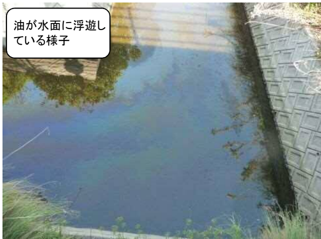
油が水面に浮遊し ている様子