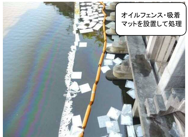
オイルフェンス・吸着 マットを設置して処理

油流出事故が起きると、市町村、県、国、消防、警察、保健所等の関係者が対応し、オイルフェンス、オイルマット等で処理します。