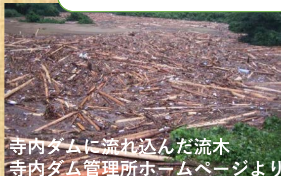
寺内ダムに流れ込んだ流木

※流木が無くなり次第終了となります。 ※多くの方々にご活用してもらいたいのので、 企業・団体等の方々は、ご遠慮下さい。