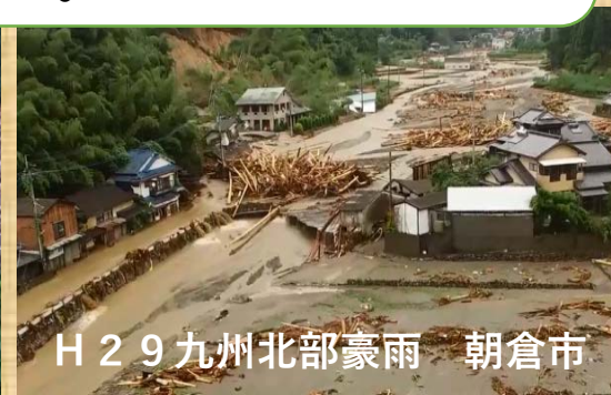
H29九州北部豪雨 朝倉市