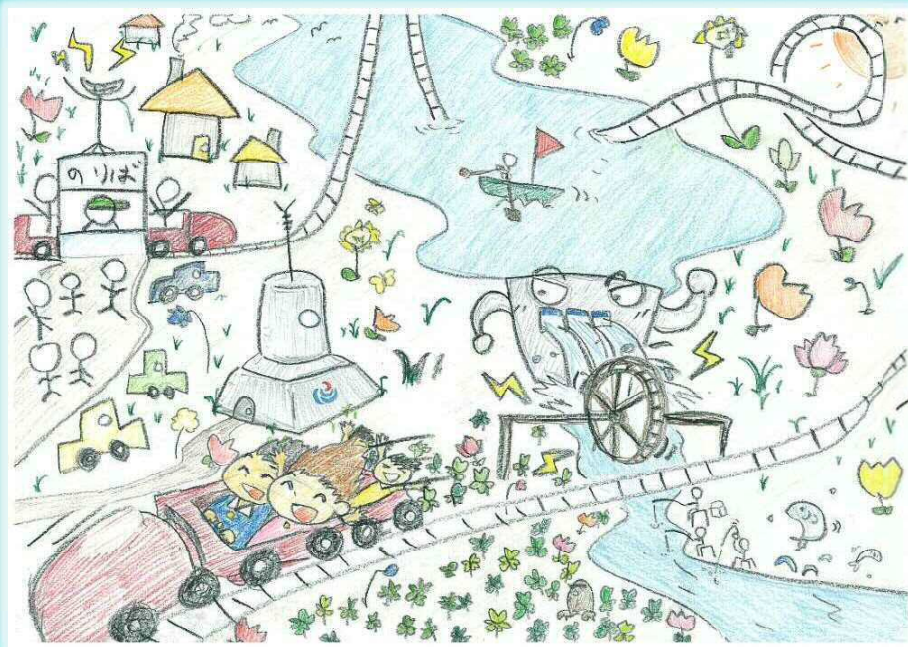
作品イメージ:緑川ダム管理所