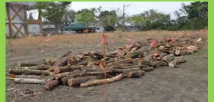
配布予定の木材 前回ぐらい

国土交通省 宮崎河川国道事務所 大淀川砂防出張所 電話 0984-42-1364