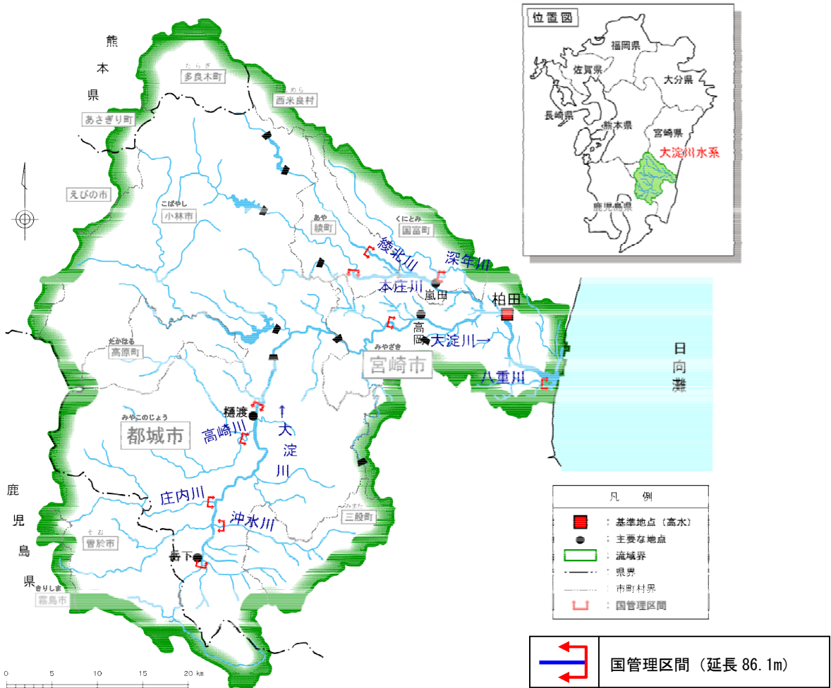
図 4.2.2 基準地点及び主要地点位置図