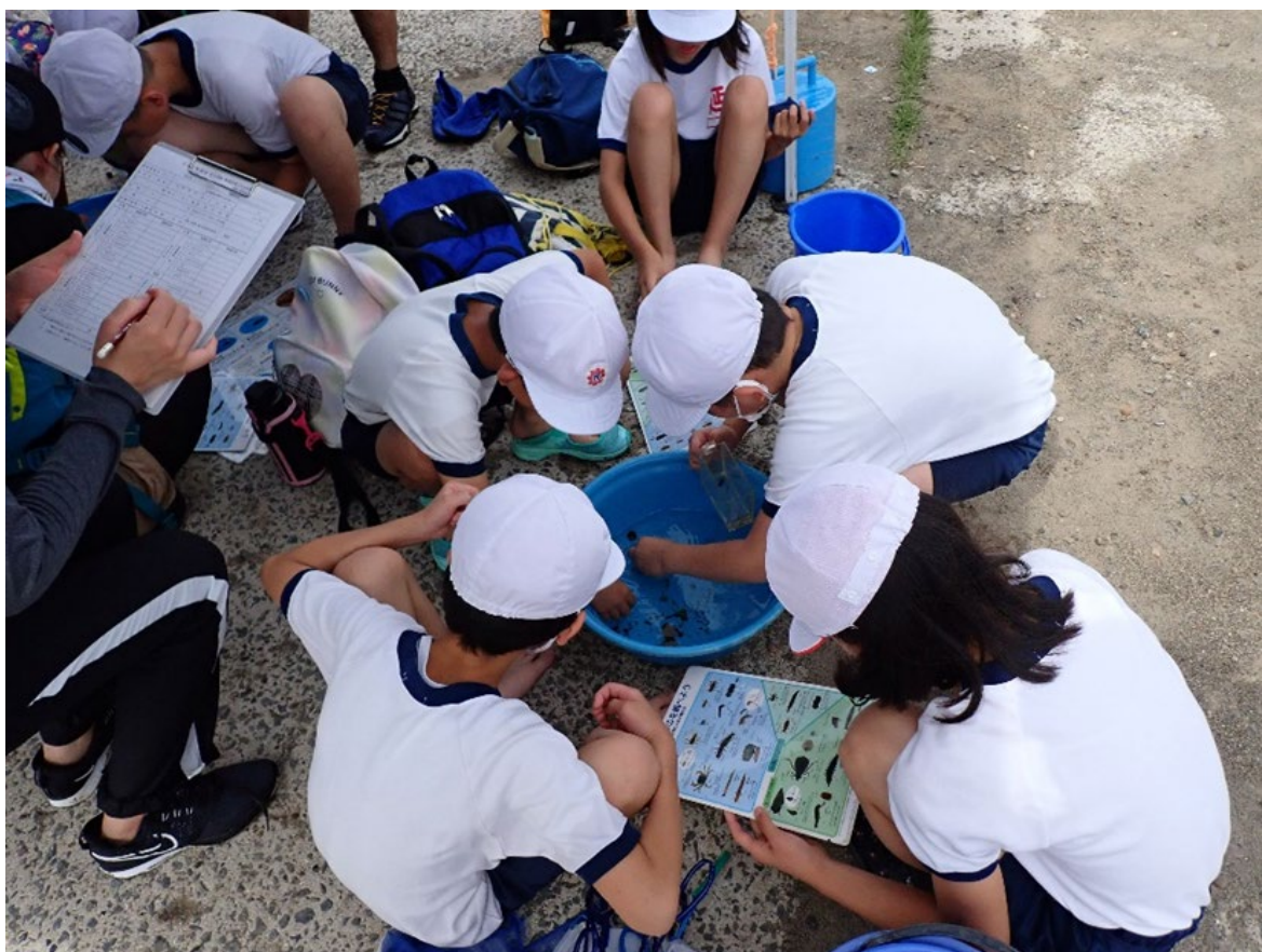
五ヶ瀬川水系 大瀬川 おおせばし 大瀬橋