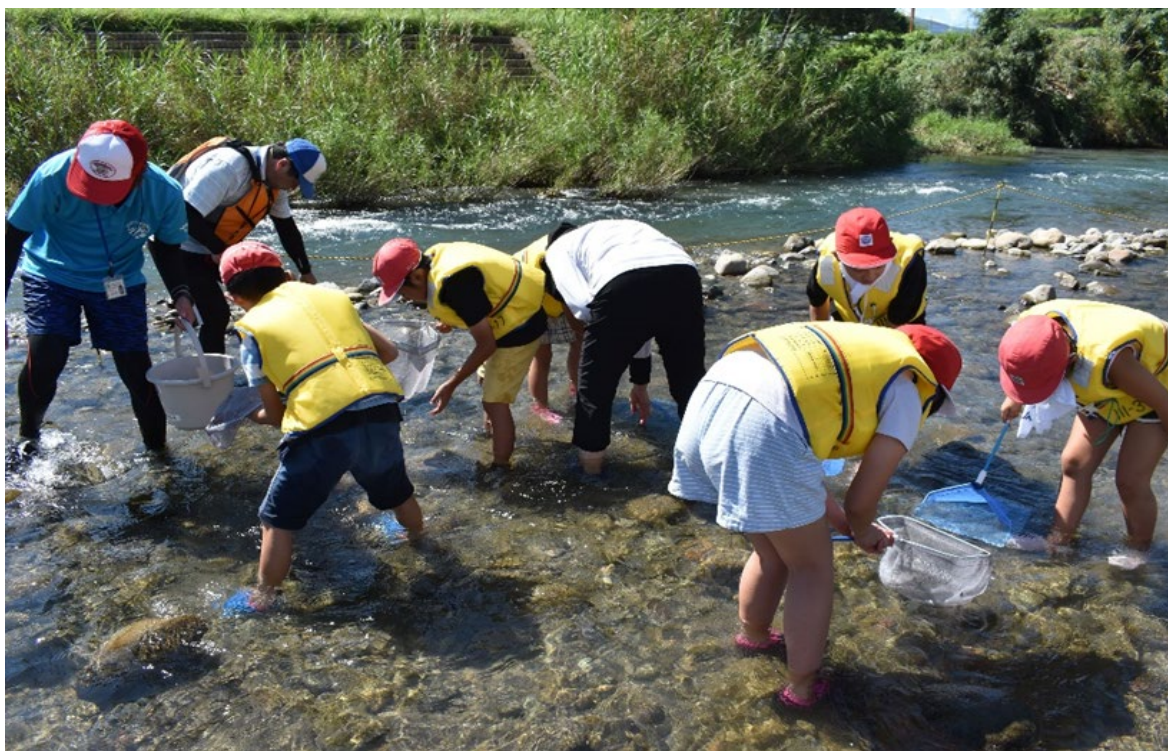
川内川水系 川内川 ふもとばし 麓橋上流