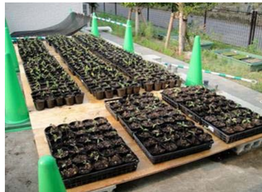
写真 3.2-2 植物の保全に向けた試験 (広葉樹の育苗試験の状況)