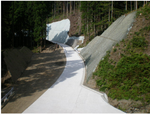
写真 3.3-1 付替林道 水浦 1号進入路