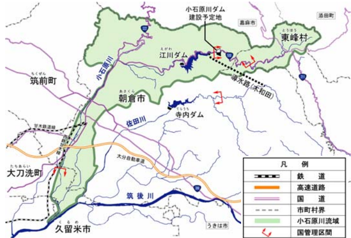
図 3.1-2 小石原川ダム建設事業位置図