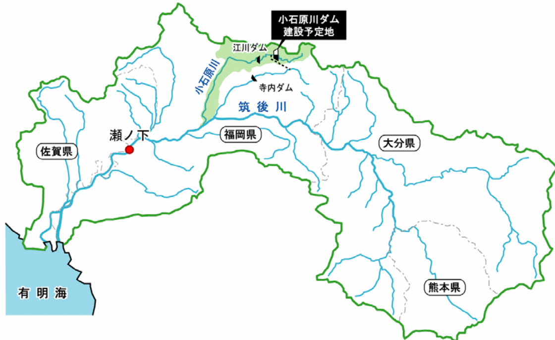
図 3.1-1 小石原川ダム位置図

小石原川ダムは、筑後川水系小石原川の上流の福岡県朝倉市において事業中の多目的ダムで、洪水調節、流水の正常な機能の維持（異常渇水時の緊急水の補給を含む）、新規利水を目的としている。小石原川ダム建設事業では、小石原川ダムを建設するとともに、佐田川（木和田地点）から江川ダム貯水池までの導水路を建設する。