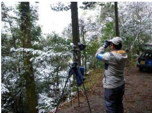
写真 3.2-1 動物の保全に向けた調査 (クマタカの繁殖状況調査の状況)

環境影響評価書における、「既設江川ダム及び寺内ダムと相まった適切な運用など下流の河川環境に配慮した操作方法について更に検討を進める」という方針に基づき、より一層の環境保全の見地から、専門家の指導・助言を得ながら、調査・検討を進めている。