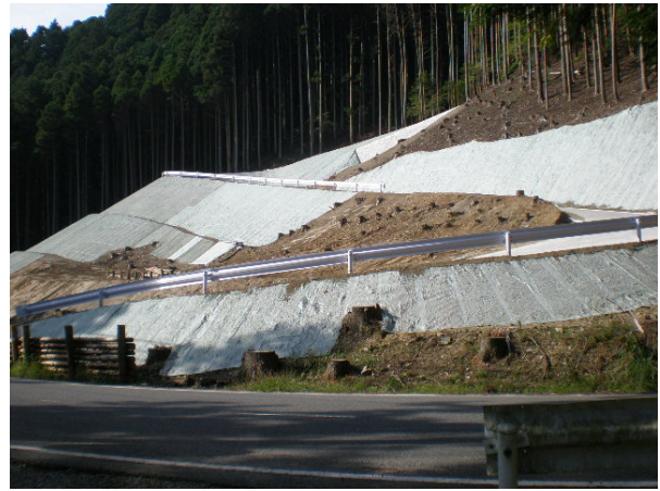
写真 3.3-2 付替林道 水浦 2号進入路