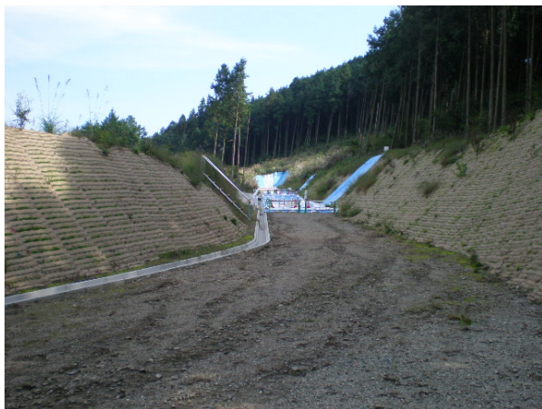
写真 3.3-3 付替国道 進入路