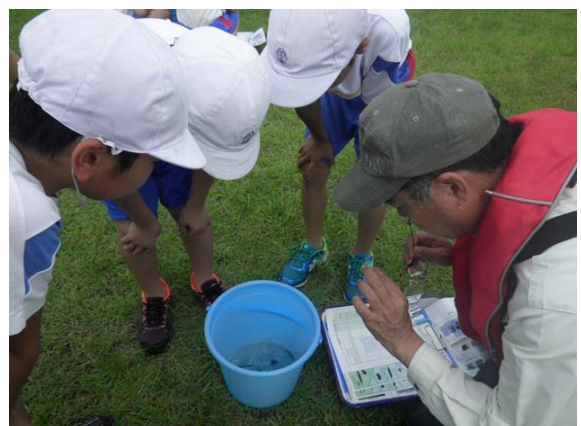
乙津川 乙津川水辺の楽校 大分市立別保小学校