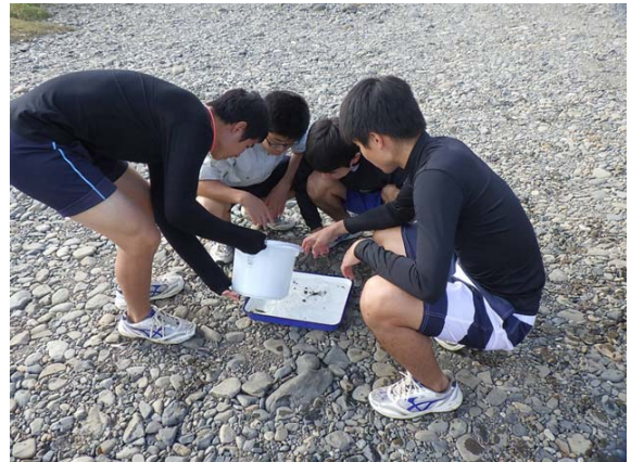
大野川 白滝橋 大分県立大分工業高等学校