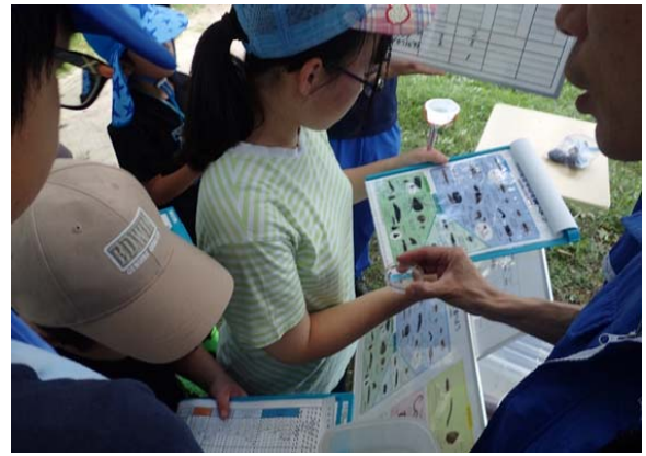
白川 代継橋 一般参加