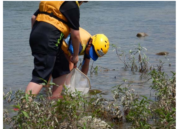
白川 子飼橋 一般参加