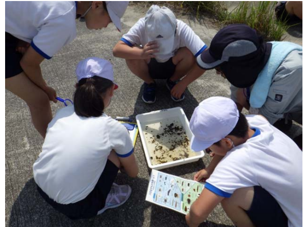
山国川 下宮永 吉富小学校