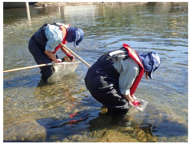
山国川 柿坂 直営