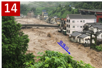
14 筑後川水系珍珠川