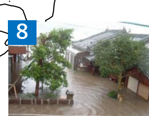
8 大淀川水系大淀川