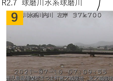
9 川内川水系川内川