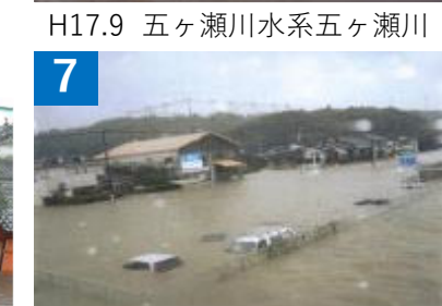
7 肝属川水系肝属川