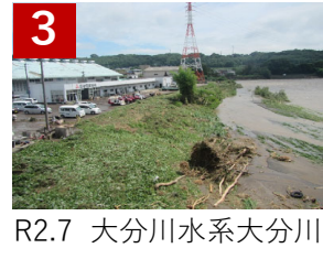
3 大分川水系大分川