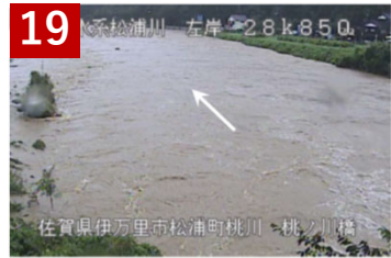
19 松浦川水系 左岸 28k850