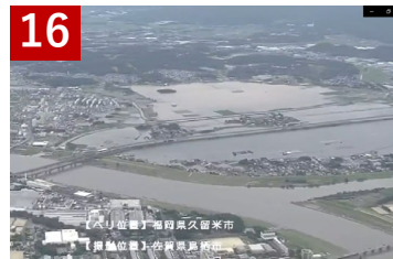
16 筑後川水系筑後川