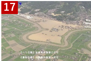
17 六角川水系六角川