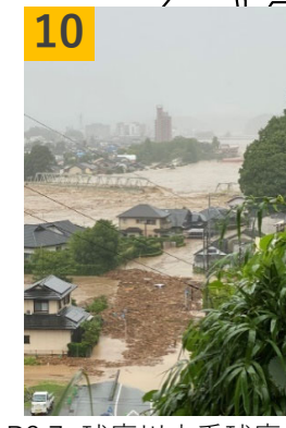
10 球磨川水系球磨川