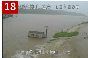
18 六角川水系牛津川