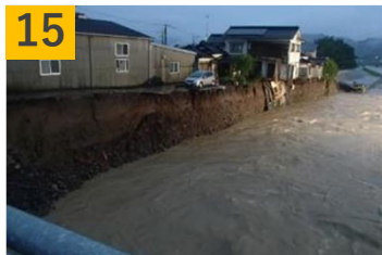
15 筑後川水系花月川