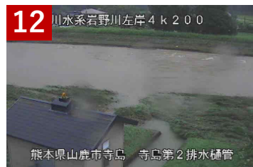
12 菊池川水系岩野川