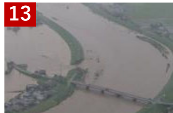
13 矢部川水系矢部川