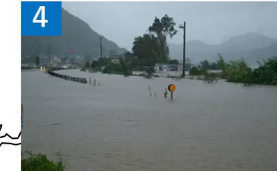
4 大野川水系大野川