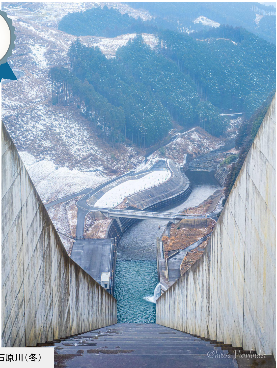
福岡県 小石原川(冬)