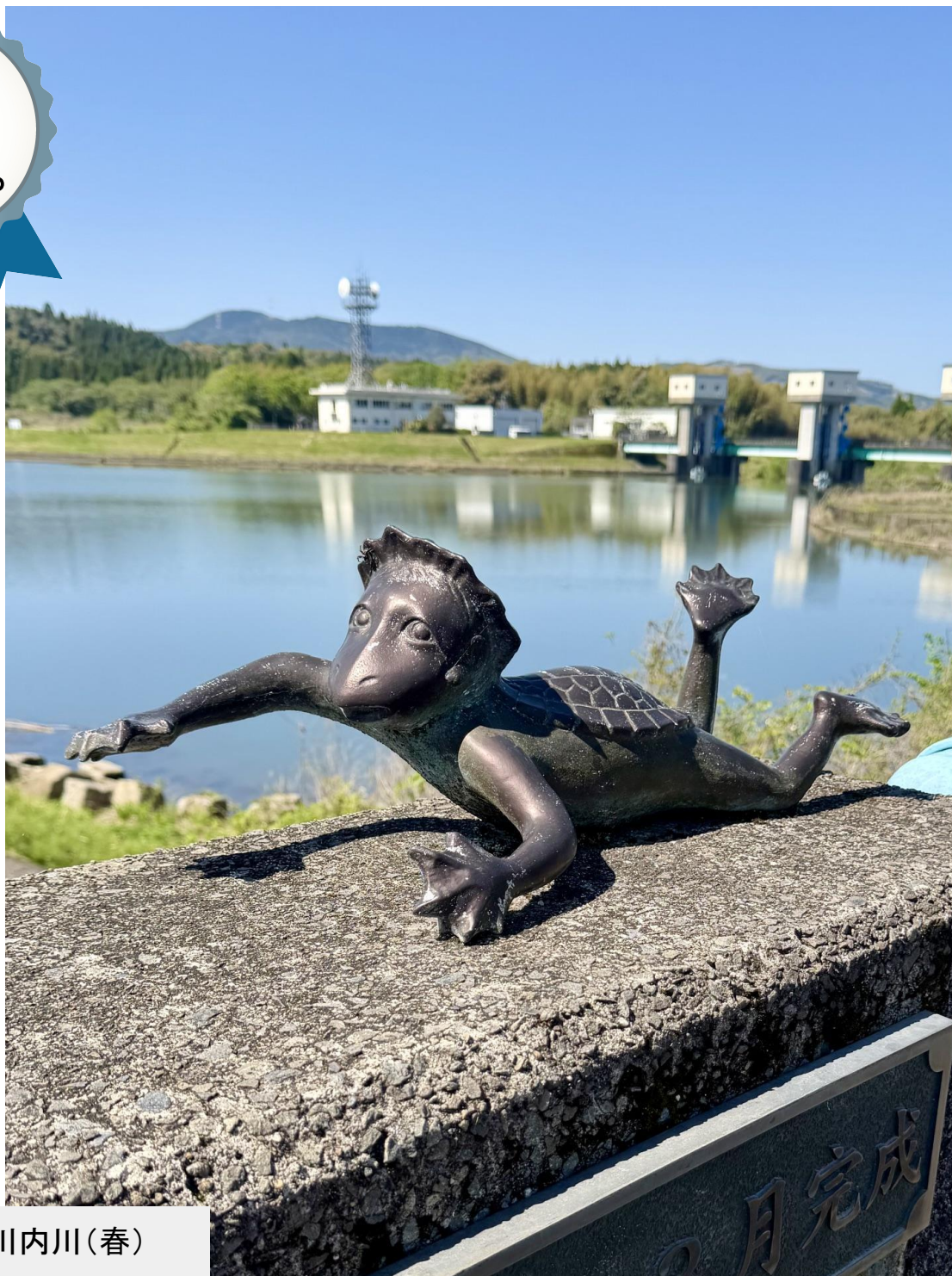
鹿児島県 川内川(春)