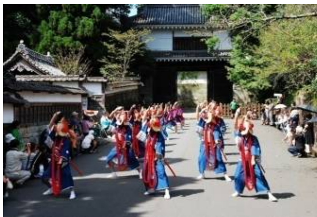
【飢肥城下町で行われる泰平踊】

重要伝統的建造物群保存地区「 にちなんしおび 日南市飢肥地区」を含み、 たいへいおどり 泰平踊等の祭礼や小村寿太郎の顕彰等の活動が受け継がれ、 おびいし 飢肥石の石垣が特徴的な飢肥城や武家屋敷等が残る飢肥城下町の区域を重点区域とし、守永家（旧飯田医院）をはじめとした歴史的建造物の保存修理、電線類の地中化、伝統的建造物群保存地区見直し調査等の事業が位置付けられています。