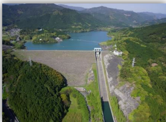
▲寺内ダムはロックフィルダムです