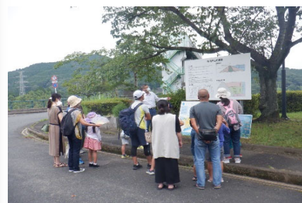
▲寺内ダムについて詳しく説明します