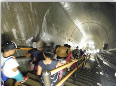
▲ダムの内部の階段を下りて、ダムの中を見学します