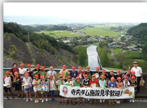
▲ダムの上からは、遠くまで見渡せます

【見学は、平日 9:00~12:00、13:00~16:00 (土・日曜、祝日、年末・年始を除く。)] 大雨等によって、出水対応等で出来ない場合もあります。