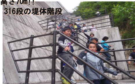
高さ70m!! 316段の堤体階段