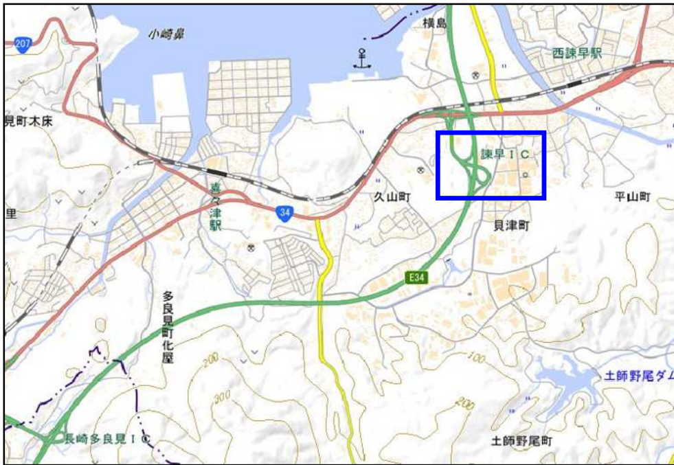
※国土地理院の電子地形図(タイル・標準地図)を加工して作成