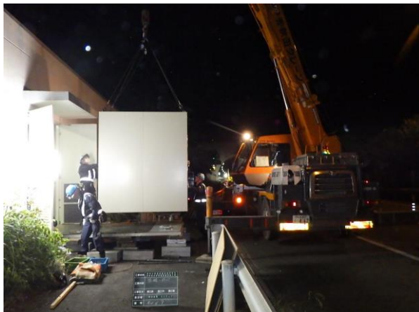
<消火ポンプ盤取り替え>

4 車線化工事における消火ポンプ盤取り替え、規制材撤去および新たな料金切り替え作業などを行います。