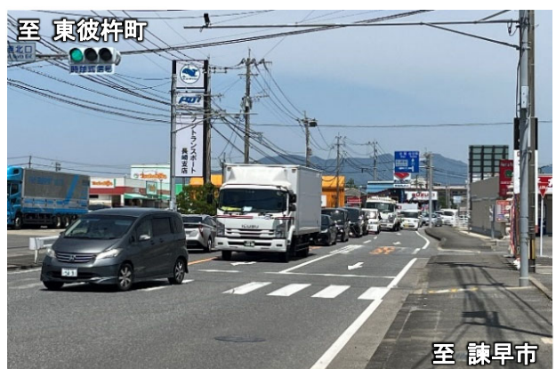
諫早市方面から東彼杵町方面を望む