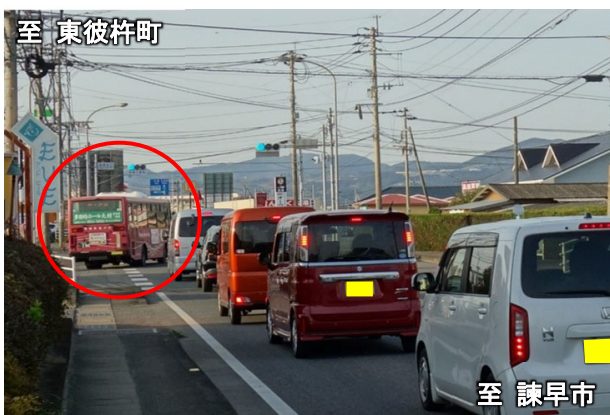
諫早市方面から東彼杵町方面を望む