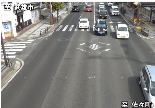
佐々町方面から武雄市方面を望む (若葉交差点)