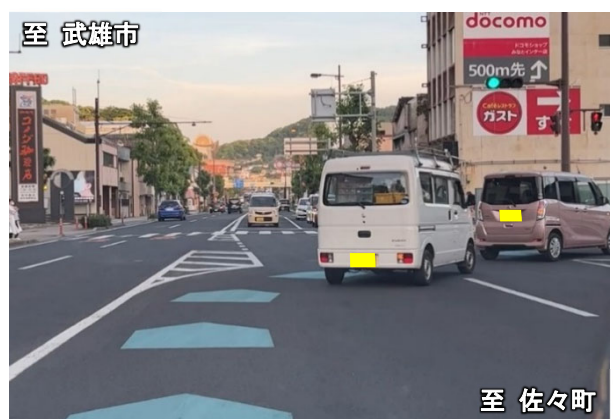
佐々町方面から武雄市方面を望む (潮見交差点)