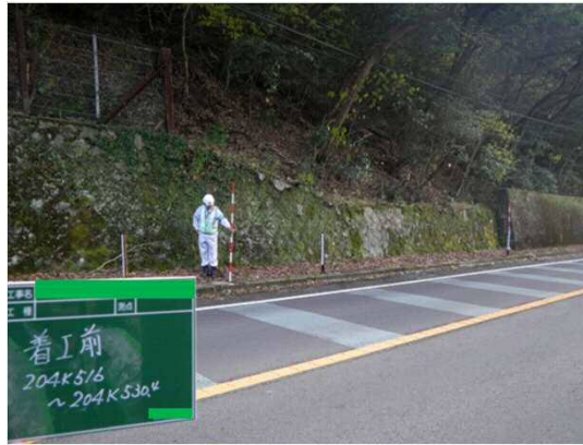
落石防護柵工施工