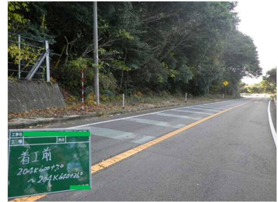
落石防護柵工施工