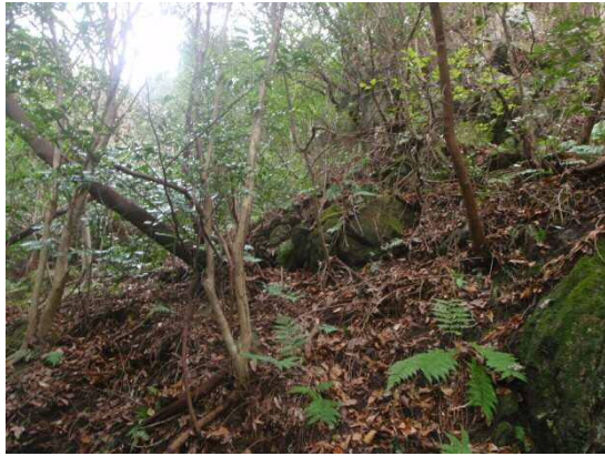
ワイヤーネット工法施工