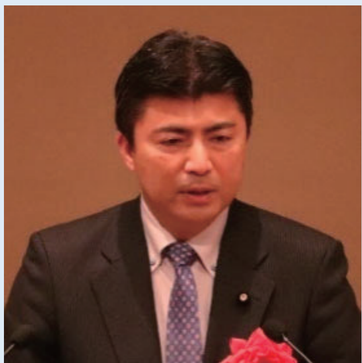
▲ 祝 辞 (古賀 参議院議員)