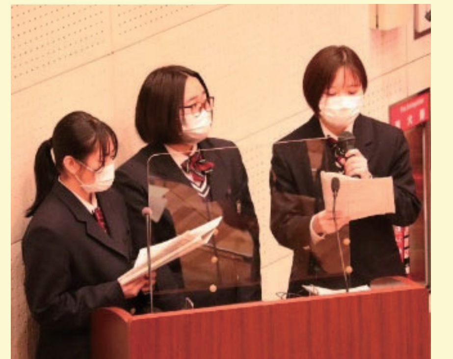
▲司会(小浜高校生徒会の皆さん)