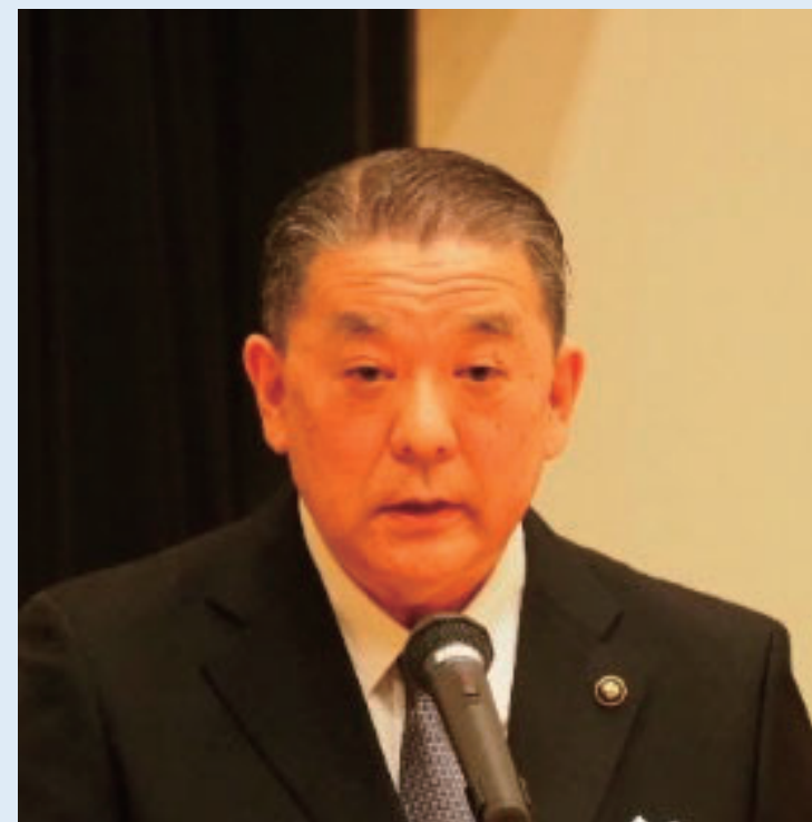
▲ 謝 辞 (金澤 雲仙市長)