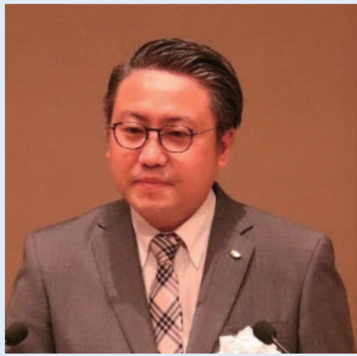
▲ 挨 拶 (大石 長崎県知事)