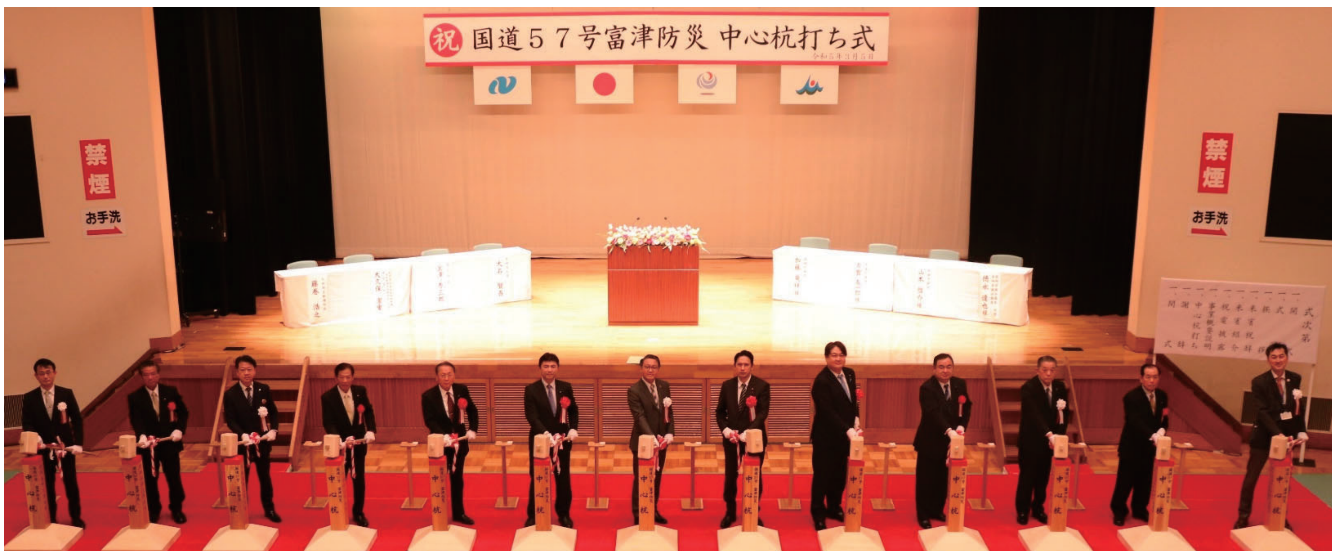
▲3、2、1、よいしょー！のかけ声で無事杭打ちが完了しました