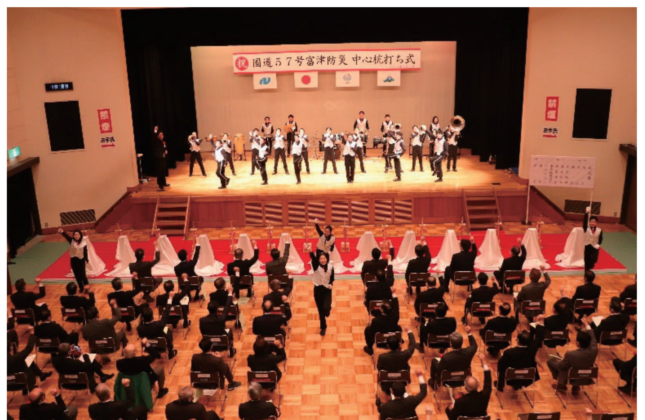
▲演奏とダンスで会場全体を盛り上げて頂きました