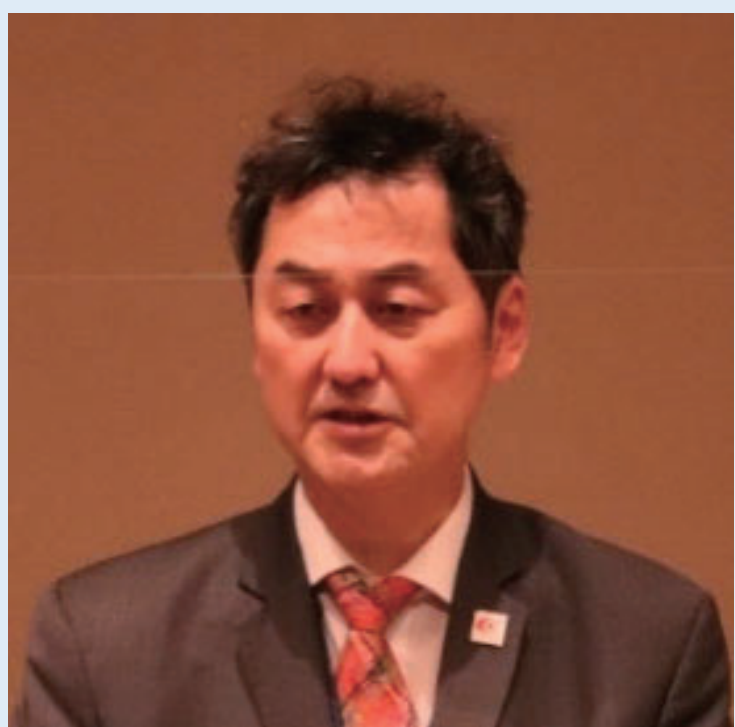
▲ 式 辞 (藤巻 九州地方整備局長)