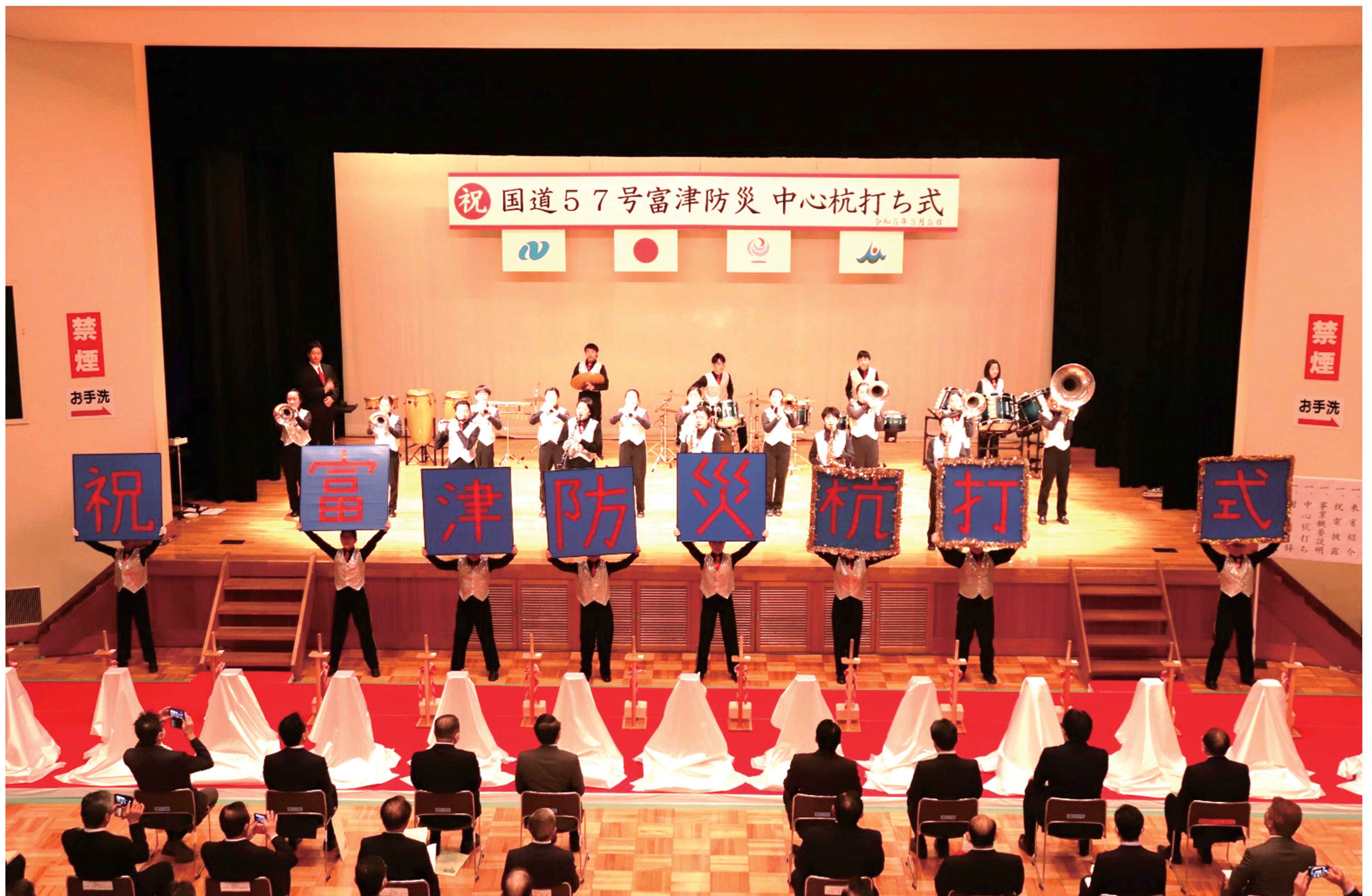
▲手づくりのボードを使ったダンスを披露