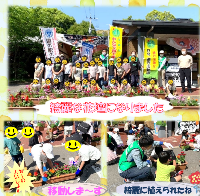
綺麗な花壇になりました

5種類の花の苗を子供たちが思い思いに選んで植え付け、それぞれの個性が光る花壇ができてきました。