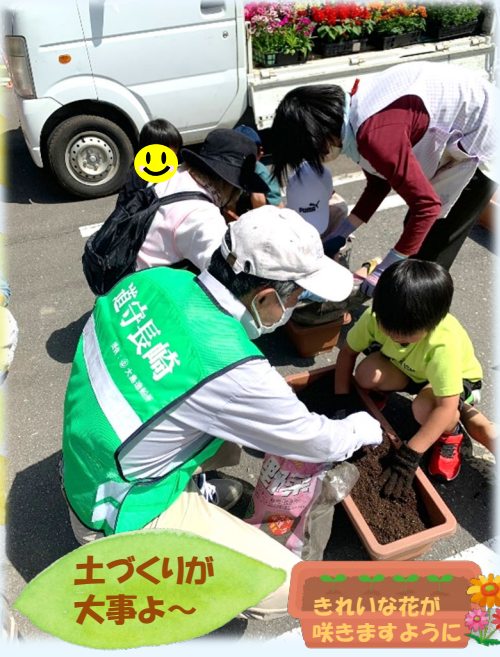
土づくりが大事よ〜