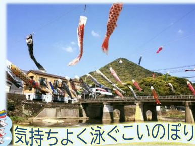
気持ちよく泳ぐこいのぼり

佐世保市相浦地区では、「こどもの日」に合わせ、相浦川史跡保存会などを中心に子ども達の健やかな成長を願い、100匹以上のこいのぼりが相浦川の上を泳がせる取り組みが20年以上続いています。