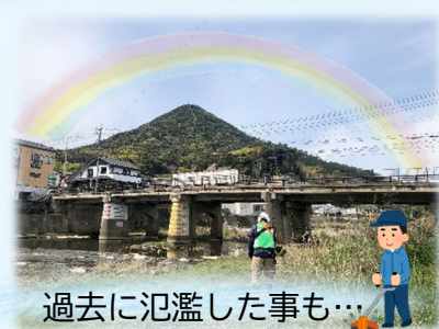
過去に氾濫した事も...

過去に氾濫した歴史も持つ相浦川。出水期には水位が上がることもあるため、佐世保・佐々地区では定期的に除草作業を実施し、地域の安心・安全のためボランティア活動を続けています。