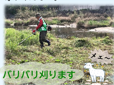
バリバリ刈ります

今年は4月23日(日)にカラフルなこいのぼりが登場し、多くの皆様の心に爽やかな風を吹かせてくれることでしょう。川辺からこいのぼりを仰ぎ見ることができるよう、除草作業を行っていますので、お近くへお越しの際は、どうぞお立ち寄りください。