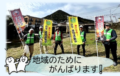
地域のためにがんばります!

過去に氾濫した歴史も持つ相浦川。出水期には水位が上がることもあるため、佐世保・佐々地区では定期的に除草作業を実施し、地域の安心・安全のためボランティア活動を続けています。