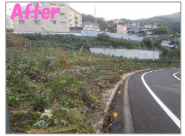
【雑草が少なくなりました】