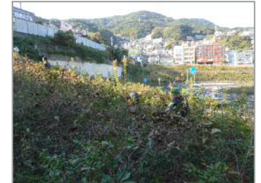
雑草に覆われ姿が見えません（右）】