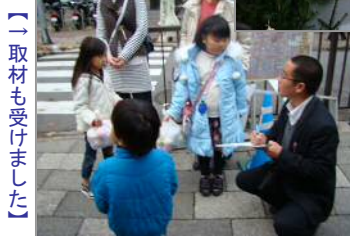
【↑取材も受けました】