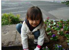
【笑顔で花植えを行いました】