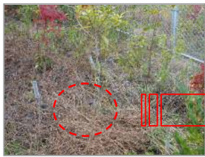
【刈った草は根本に利用】