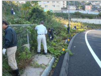
【雑草の処理も一苦労です（左）