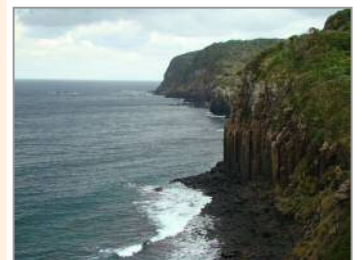
【平戸市生月町“塩俵の断崖”】 (H23. 10撮影)