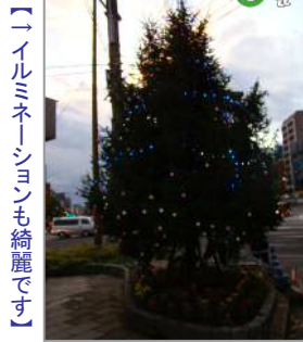
【↑イルミネーションも綺麗です】