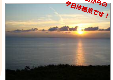
【長崎市外海町“道の駅 夕陽ヶ丘そとめ”】 (H23. 10撮影)