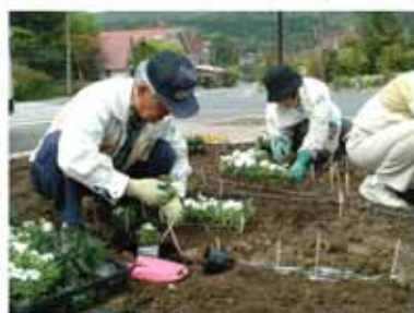
<丁寧に並べて植えます>