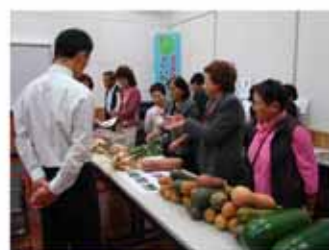
<昨年の“屋台村”のようす>