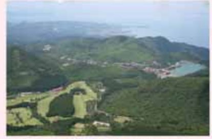
<雲仙ロープウェイ展望台からの風景>

天気の良い日に、是非このマップを持って、雲仙の山を登ってみるのはいかがでしょう。