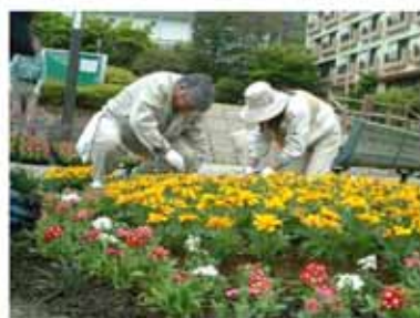
<植え付け完了までもう少し>