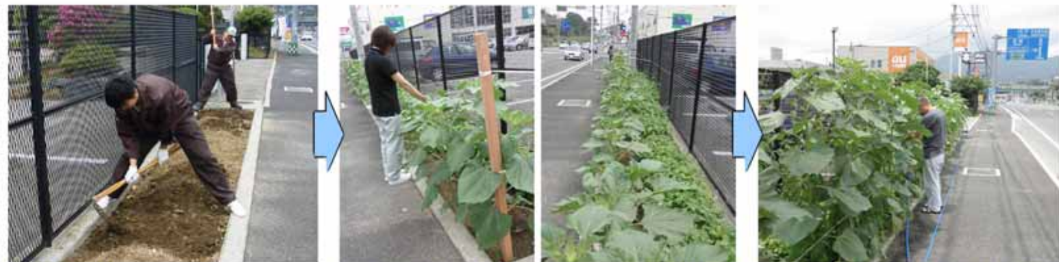
【4月27日】土を耕すところからスタート！