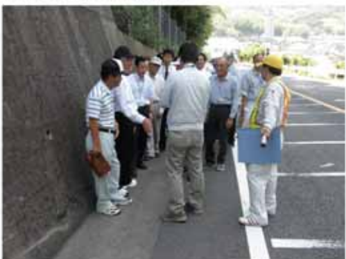
【子どもたちは、こんなに狭い路肩を通学路として利用しています。】

今後も、地域住民や学校、警察、行政合同で合意形成を図りながら、誰もが安全で快適に利用できる道路づくりを進めていきたいと思えます。