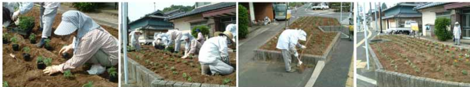
【植え替え作業から後片付けまで、とても丁寧にやってきました。国道沿いがきれいな花で彩られ、地域の方も喜んでいます。】