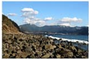
千々石断層（左）と曲り海岸

遣欧少年使節「千々石ミゲル」本名清左衛門：南宗画を広く天下に主唱した「釧雲泉」：大正天皇が皇太子の頃、訓育に当たった「橋周太」。の業績を讃え、遺徳を顕彰し、平成3年3月、千々石町は、役場の緑地に像を建立しました。