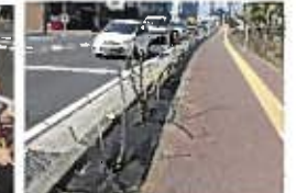
13日 準備作業 シート張り作業