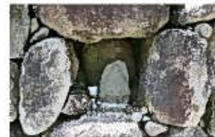
石垣の中のキリシタン石仏