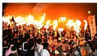
「観桜火宴」松明武者行列