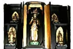
七番霊場 「桜井寺観音」 観音堂歌めぐり (詠み人 不詳)