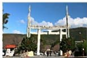
橋神社大鳥居と大門松