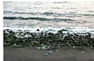
砂浜に出てきた玉石