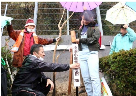
卒業記念樹の表示板を打ち込む