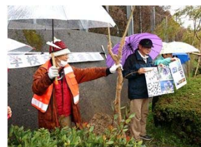
作業前にジャカランダの説明