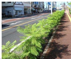
ジャカラング：8月撮影