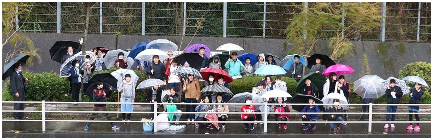
6年1組 36名と小浜温泉57のみなさん