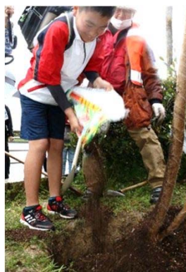
根巻きしたジャカラングの根元に 有機培養土を入れる