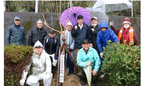
平松自治会と小浜温泉57のみなさん