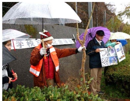
作業とジャカラングの説明 「小浜温泉57」