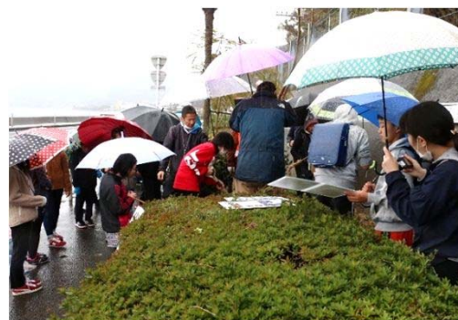
降りしきる雨の中 植樹