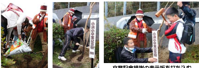
卒業記念植樹の表示板を打ち込む