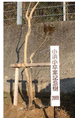
ジャカラング 樹高3m