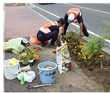
マリーゴールドを植える

花壇のジャカラダを掘り出す 販売は予約制です 樹高 約0.6m 1,000円 樹高 約0.8m 2,000円 樹高 約1.0m 3,000円