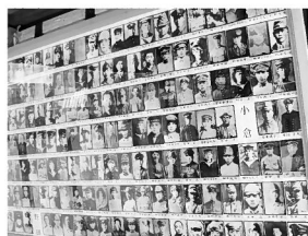
「英霊舎」 戦没者の写真

国道57号沿いに大鳥居がある。御影石で高さ9.7m、柱間7.3m、柱直径91cm。石造りの鳥居では日光東照宮の9.2mを超える。