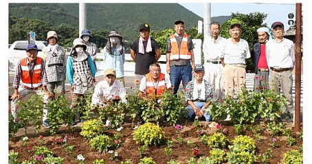
上野田自治会・小浜温泉57のみなさん