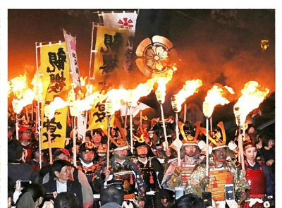
かんおうかえん 観桜火宴 武者松明行列