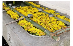
ちょうすばち 御影石の手水鉢 6月 あじさい 7月 ひまわり