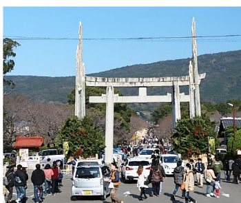
大鳥居と大門松 初詣 参拝に県内外から訪れる