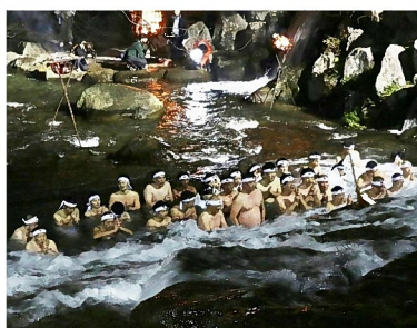
かんちゅうみそぎ 大寒 寒中禊 軍神橋下の千々石川