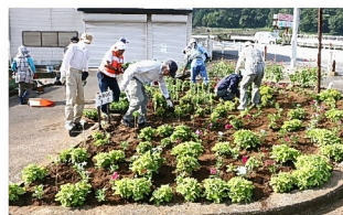
「かみのだ花壇」日野草・千日紅を植える