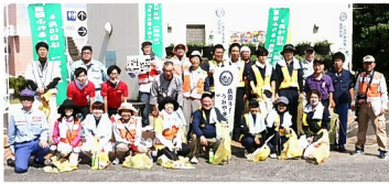
昨年の参加者 2021. 8. 3