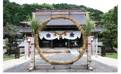
なごし おおはらえ ち 夏越の大祓 「茅の輪」