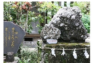
国歌の歌詞にある 「さざれ石」