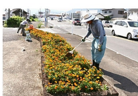
「3分団前花壇」マリーゴールドに施肥