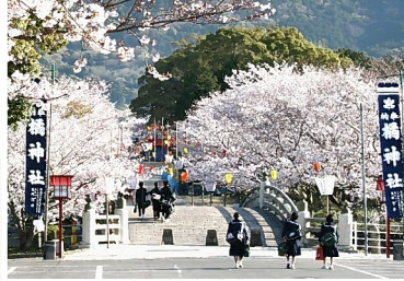
くにしんばし 軍神橋