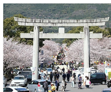
御影石の大鳥居 花まつり