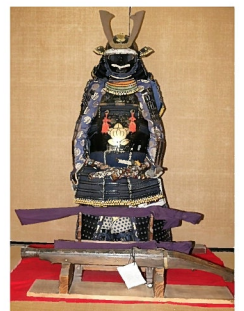
かんおうかえん 観桜火宴の鎧兜