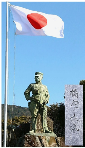
「橋中佐像」 彫塑界の巨匠 北村 西望 作 石碑の揮毫 西望書