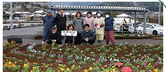
上野田自治会のみなさん