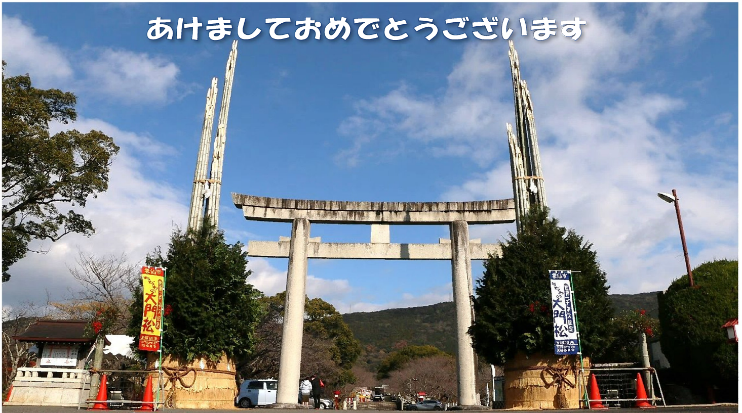
日本風景街道 「島原半島うみやま街道」 橋神社大門松 14m