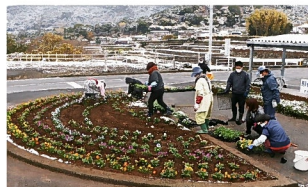
半円形に花を植える