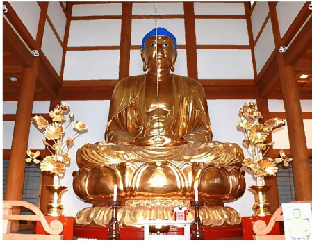
雲仙温泉には 外国の人が訪れることで 大仏の説明は 英語・韓国語・中国語で表示

島原半島 鎮西八十八ヶ所霊場 第二十三番札所 「雲仙山 満明寺」 雲仙市小浜町雲仙